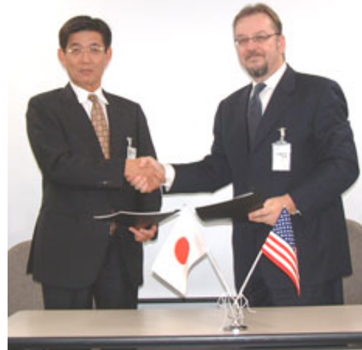
【販売代理店契約調印式の模様】